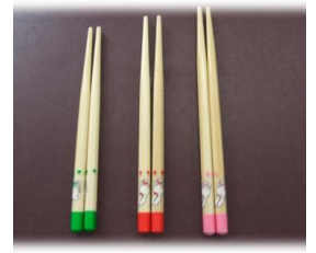
クラスによって長さが違います。

正しく箸を持つ近道は、離乳期にしっかり手づかみ食べをすることです。手づかみ食べをすると運動機能や感覚機能が発達し、その後のスプーン、フォークへの移行もスムーズになります。また、手先を使った遊びや手首をしっかり動かすことも大切です。