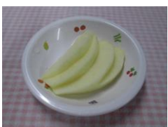
スマイル、ステップ組の 幼児食 から 1/8切 皮なし 4枚スライス ※スマイルは 1/16切 2枚スライス

8月後半から梨、りんごの提供が始まります。梨やりんごは、子どもにとって小さく噛み砕きにくく、窒息事故を起こす可能性があります。保育園では、果物の提供は幼児食になってからとなっています。これまで制限をしておりましたが、弁当日の果物についても離乳食を食べているお子さんにつきましては、 弁当日に果物を持参されないようにお願いします。 また、月齢ごとに切り方を変えています。玄関掲示もしますので確認をお願いします。ご家庭でも掲示を参考に食べてみてください。