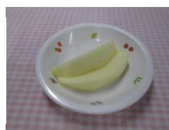
ジャンプ組 1/8切 皮なし 2枚スライス