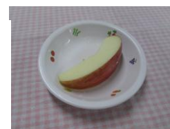
パワフル組以上 1/8切皮あり